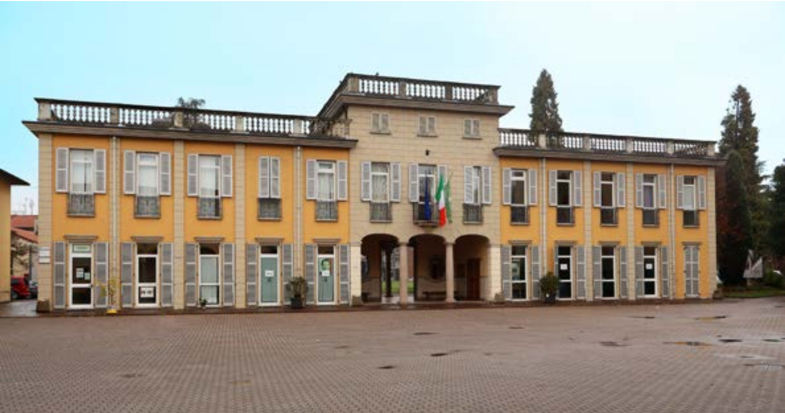
Centro Salesiano di Arese